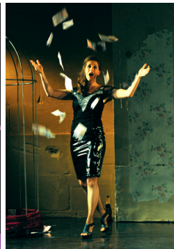
La Traviata, von G. Verdi