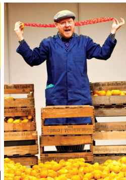
Der Liebestrank, von G. Donizetti