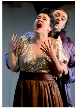
Tosca, von G. Puccini