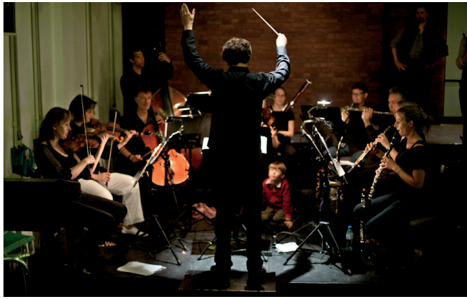
Das Orchester von Münchens Kleinstem Opernhaus